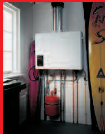
EcomLine Classic HR Combi 22 of 30 met ingebouwde 25 liter boiler (horizontale uitvoering). Een EcomLine Classic HR 43 of 65 (zonder boiler) ziet er hetzelfde uit.