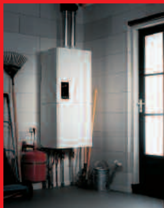
EcomLine Classic HR Combi 22 of 30 met ingebouwde 25 liter boiler (verticale uitvoering).

Beide boilers kunnen ook worden gecombineerd met de EcomLine Classic HR 43.