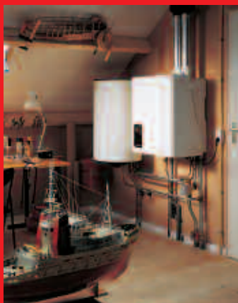
EcomLine Classic HR 22 of 30 met 80 liter boiler. Er is ook een 120 liter boiler.

Beide boilers kunnen ook worden gecombineerd met de EcomLine Classic HR 43.