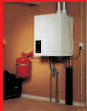
EcomLine Classic HR 22 of 30.